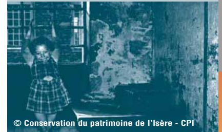
© Conservation du patrimoine de l'Isère - CPI