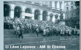
© Léon Leponce - AM St Étienne